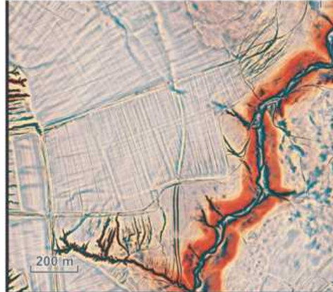
Spečený val, nazývaný aj val obrov.

vín v obci Rybník alebo aj v okolí Malých Kozmálovíc.