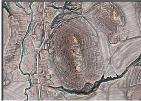
Vrch Hrádok v Bohunicach takto zachytil LIDAR.

Osidlený bol už v dobe kamenej. V stredoveku, po tatárskom vpáde, tu stálo opevnenie, ktoré slúžilo na ochranu cesty k banským mestám, ako boli Pukanec či Banská Štiavnica.