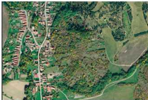
Vrch Hrádok v Bohunicach, letecká snímka.

„V čase tureckého ohrozenia bolo toto miesto zapojené do systému varovania obyvateľstva. Je tiež dôkazom toho, že v minulosti sa na pestovanie viniča využívali strmé svahy,“ píše sa v obecnej monografii.