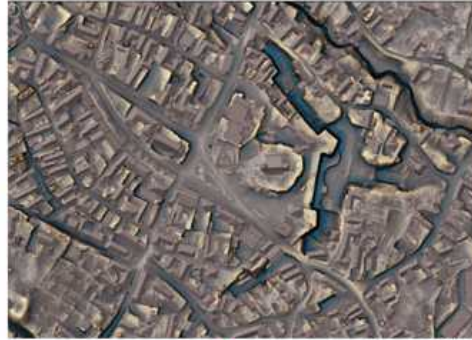
Opevnené centrum Pukanca, LIDAR. Zdroj: ÚGKK SR, vizualizácia: T. Lieskovský, SvF STU Bratislava

„Vidieť tam množstvo terás, ale aj pozostatky kamenných – kamenných rún, čo sú navrhnuté valy z kamena, ktoré predstavujú starú formu viniča, obdobne aj pozostatky starých zaniknutých pivníc a domov,“ opisuje Lieskovský, čo sa zobrazilo po spracovaní dát na monitore počítača.